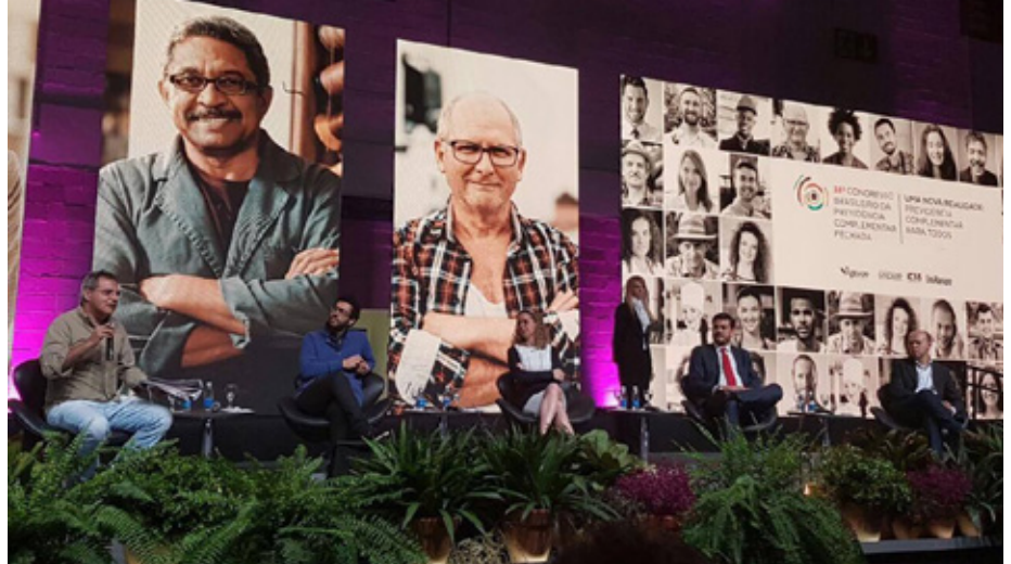
Painel do 38º Congresso Brasileiro da Previdência Complementar Fechada da Abrapp

O Congresso é o maior evento do setor, reuniu cerca de 3500 participantes, e teve como tema central “Uma nova Realidade: Previdência Complementar para Todos”.