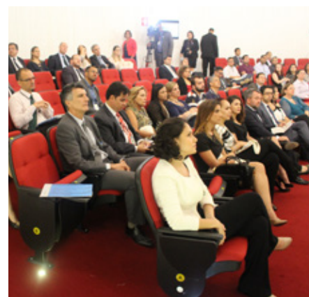
Participantes do evento