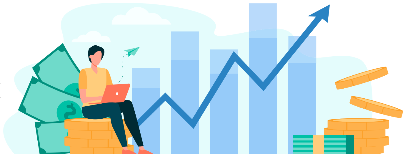
Ilustração adaptada do Freepik

A Funpresp-Jud publicou em seu site o Regulamento dos Perfis de Investimentos , aprovado pelo Conselho Deliberativo, conforme a Resolução CD nº 12/2021 . O modelo escolhido pela Fundação é denominado Ciclo de Vida, com utilização de Fundos Data-Alvo.