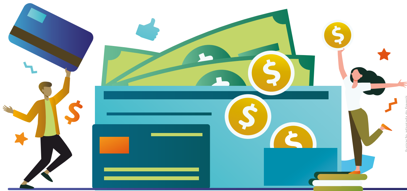
Ilustração adaptada do Freepik