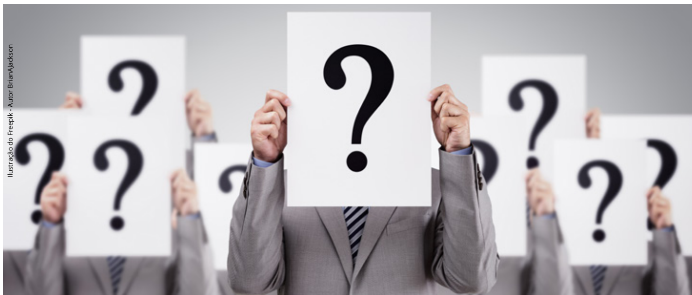
Ilustração do Freepik - Autor BrianAJackson